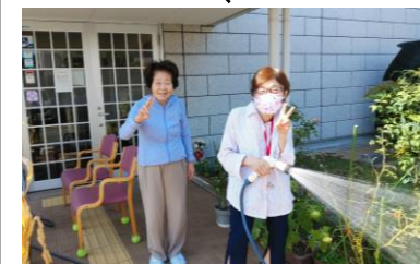
外は気持ちいいわ〜♪

お天気の良い日に、外気浴を兼ね てお花や野菜の水やりです♪ 写真を撮らせてください!!の声掛 けに…こんな素敵な笑顔を頂きました〜☆ この後は… なんでもない世間話に花が咲き♪ 気持ち良く、お外で楽しいひと時を 送ってられました♪