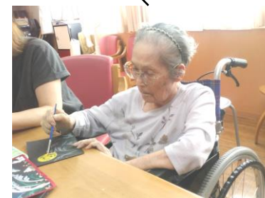
とても丁寧に仕上げています!

フロアでは毎月職員が考えた飾 りつけを皆で作ります!もう9月 になるということで皆で制作☆ 「こんなんようするかな〜」と皆 さん真剣に取り組んでくださり完 成☆ 綺麗にできましたね!と言 われると「えへへ(笑)そうかな♪」 と照れながらも嬉しそう!またフ ロアが明るくなりました!