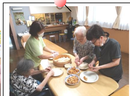
先生!これでいいですか?

お天気の良い日に、外気浴を兼ね てお花や野菜の水やりです♪ 写真を撮らせてください!!の声掛 けに…こんな素敵な笑顔を頂きました〜☆ この後は… なんでもない世間話に花が咲き♪ 気持ち良く、お外で楽しいひと時を 送ってられました♪