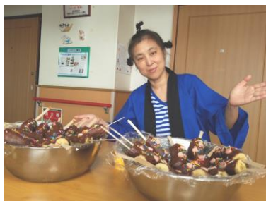
いろんな縁日楽しみました♪

※ フロアごとや少人数にて密にならない状 態で楽しんでいただけるような企画を考え ています♪