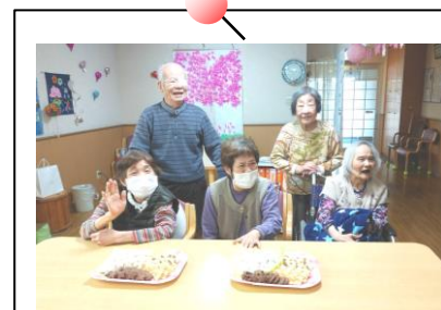
クッキー作りました♪

いろんな種類をたくさん作りました♪出来上がったクッキーを前に笑顔で、ハイ！ポーズ☆