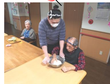
うどん作りに挑戦中！！

今回の調理の日はうどん作りをしました♪粉、塩、水加減と微妙な調整しながらひたすらコネコネ…やはり…さすがの男性軍の力♪あつという間にツルツル腰のある素敵な生地、ささっと茹でてつるつる～っと！お味は…少しすいとんに似ている出来栄え！またやりましょ♪